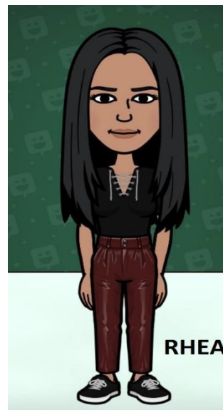
نواموز مالی دانشجویان