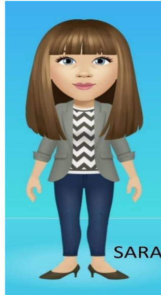
مشاور مالی دانشجویان