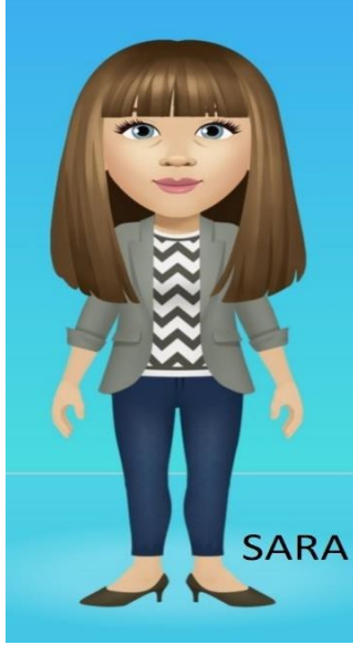
مستشار تمويل الطلاب