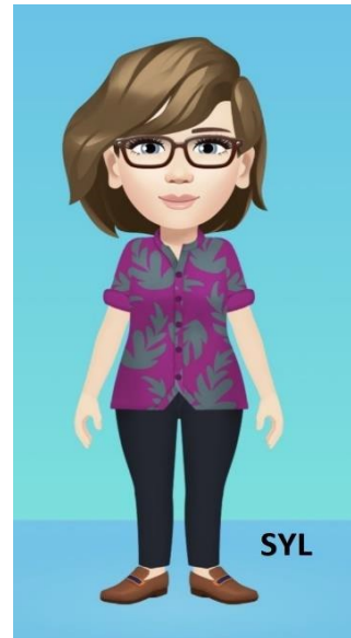
مستشار تمويل الطلاب