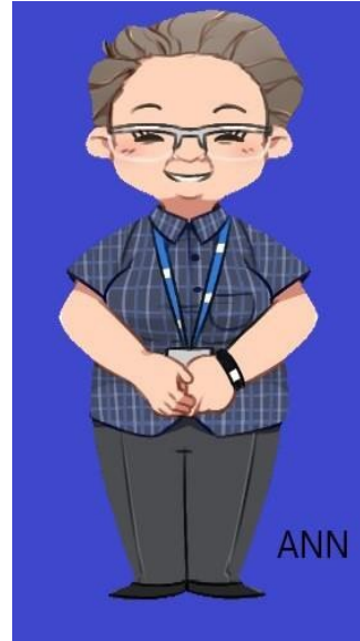
مدير تمويل الطلاب