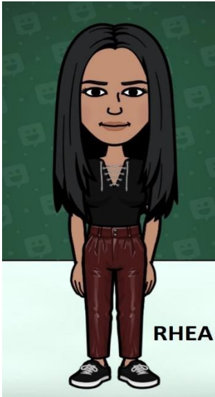
متدرب تمويل الطالب